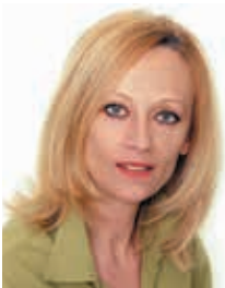
Za Belupo piše: Diana Glavina

UZ NAJAVLJENE REFORMSKE ZDRAVSTVENE MJERE KOJE BI TREBALE OBUHVATITI RACIONALIZACIJU, FUNKCIJSKO SPAJANJE BOLNICA I OBJEDINJENU JAVNU NABAVU, MOŽE SE GODIŠNJE UŠTEDJETI IZMEĐU 500 I 600 MILIJUNA KUNA ŠTO JE SAMO KAP U MORU OD OSAM MILIJARDI KUNA DUGA